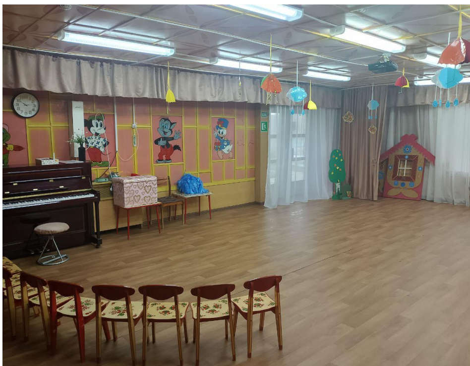
Музыкальный зал корпус 10