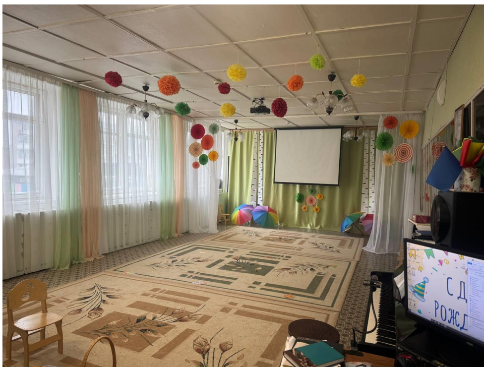
Музыкальный зал корпус 1