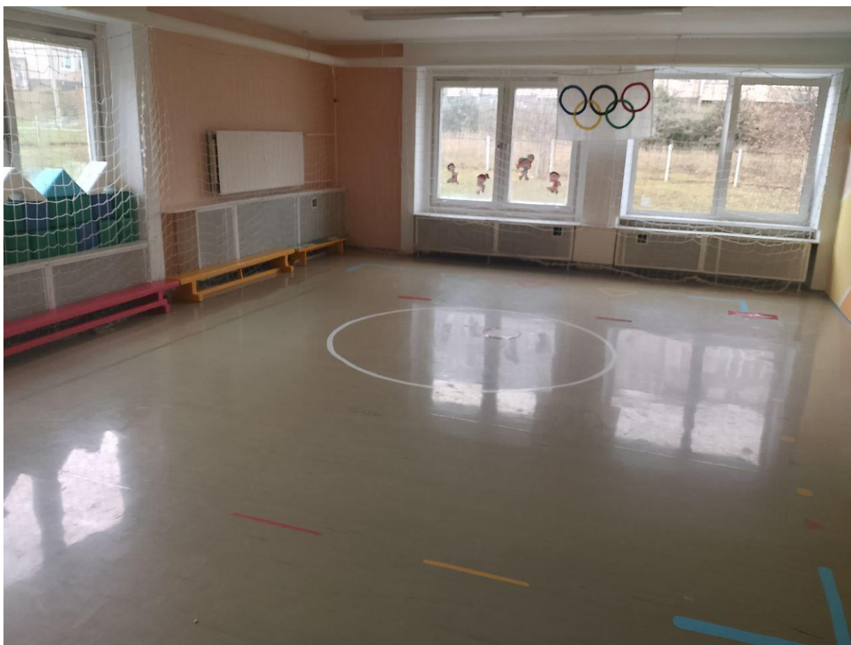
Объект спорта: оборудование для занятий физической культурой и спортом (в физкультурном зале к. 10)