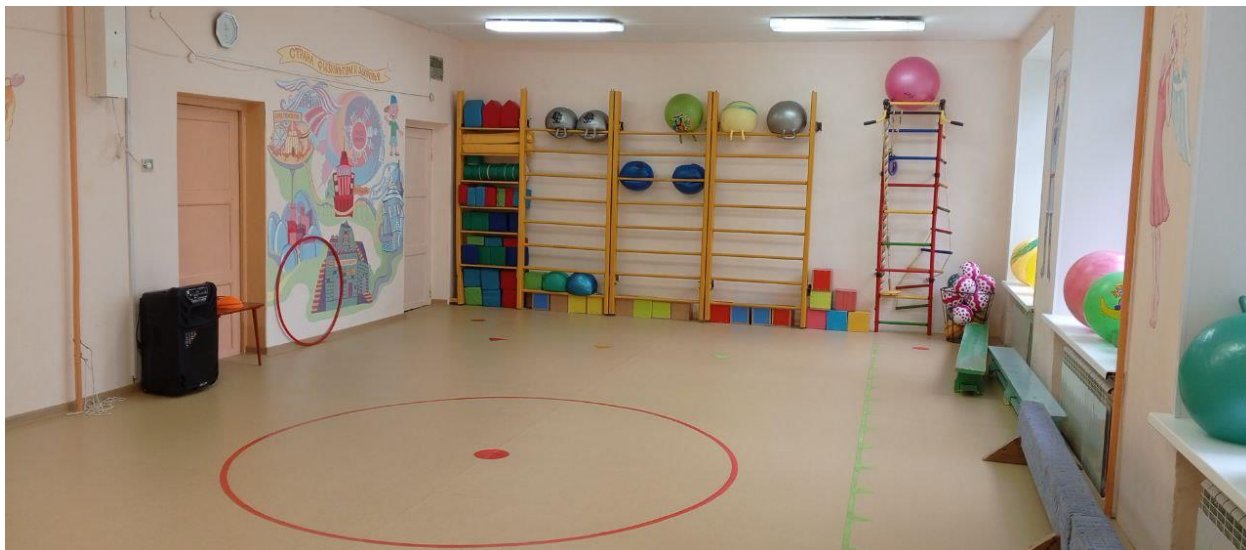
Объект спорта: оборудование для занятий физической культурой и спортом (в физкультурном зале к. 5)