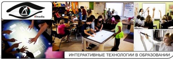
ИНТЕРАКТИВНЫЕ ТЕХНОЛОГИИ В ОБРАЗОВАНИИ