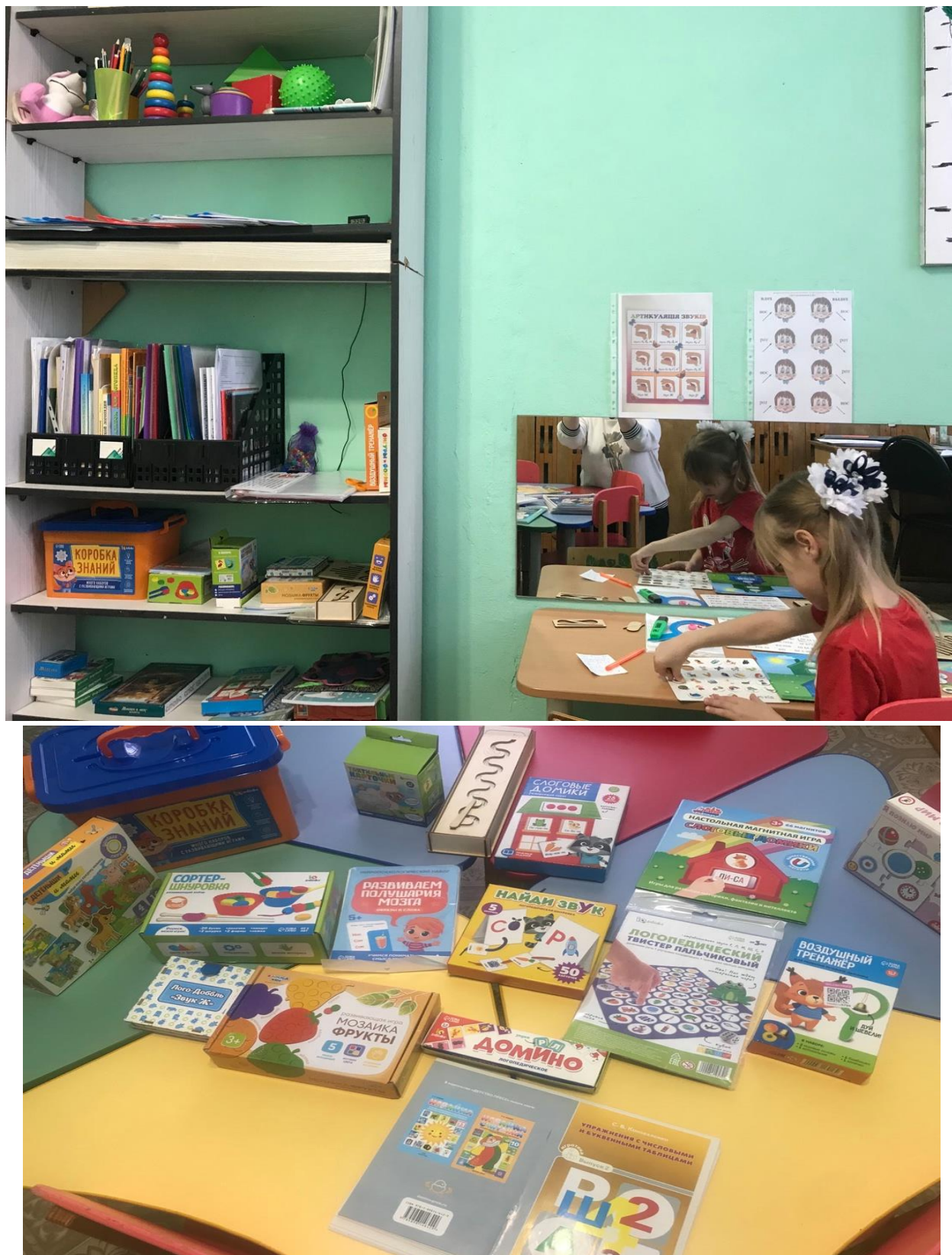
Фото логопедического кабинета и предметно-пространственной развивающей среды.